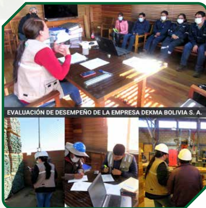
EVALUACIÓN DE DESEMPEÑO DE LA EMPRESA DEKMA BOLIVIA S. A.